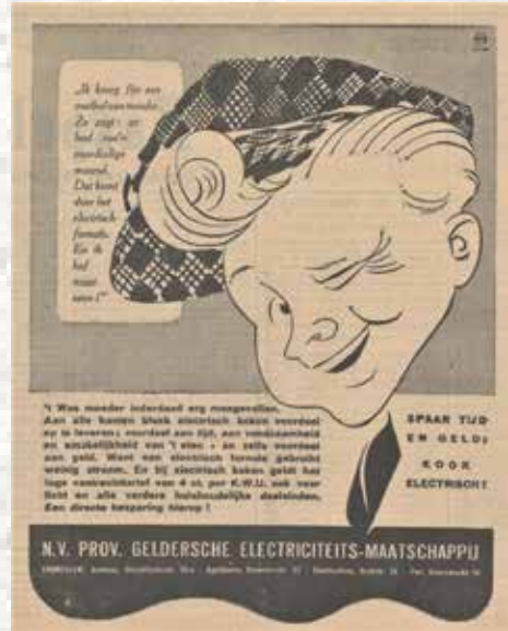
Arnhemse Courant 5 oktober 1934

In Arnhem telde het Gemeente Electriciteits Bedrijf begin 1930 niet meer dan tien gezinnen die van die voorziening gebruik maakten. Maar er was een verandering op til. Op de Nijverheidsschool voor Meisjes aan de Rijnkade werden dat jaar vergelijkende proeven gehouden met koken op kolen, petroleum, gas en elektriciteit. De proef bestond uit het bereiden van een driegangmenü (vooraf vermicellisoep, daarna varkenslapjes met spruitjes en gekookte aardappelen, en als toetje vanillevla met bitterkoekjes), een tweegangmenü (witlof met aardappelen en rijstebrij), en een serie van acht flensjes. Het bereiden van deze maal-